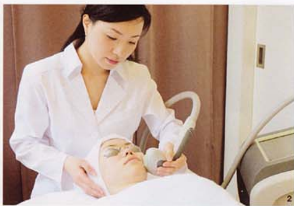
2 特に顎の下からフェイスラインを集中して行くと、小顔効果が大きい。

頬十こめかみ 3万1500円(通常6万3000円)、顔全体 4万2000円(通常8万4000円) ※7/31まで、ともにHanako限定トライアル価格。